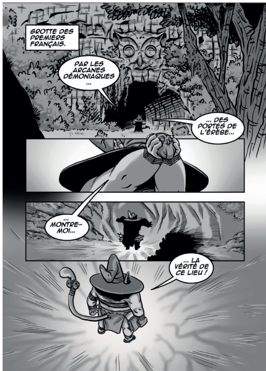
Planche extraite de la BD (Chapitre 7) (© Rémi MOREL / Anaor)

Propos recueillis par Eva BAQUEY, Poimaskat